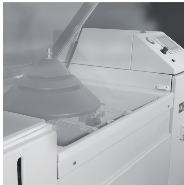
Test de niebla salina | FLORIDATEST

La alta calidad de estos tratamientos está confirmada por los exitosos resultados del test de niebla salina (los productos sobrepasan ampliamente las 2.500 horas) y las estrictas pruebas internacionales entre las que se encuentra el TEST FLORIDA.